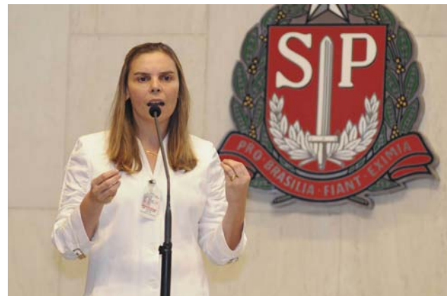
Dra Jaqueline Issa em discurso na Assembléia Legislativa de São Paulo